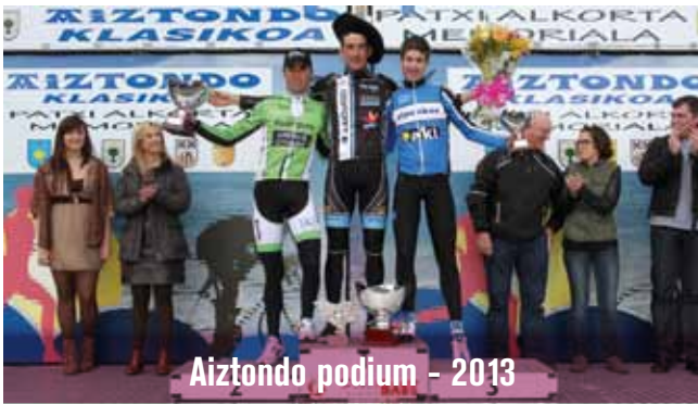
Aiztondo podium - 2013