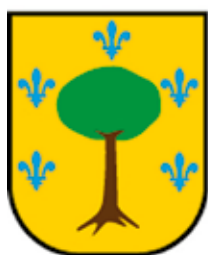
AMASA-VILLABONA Villabonako Udala