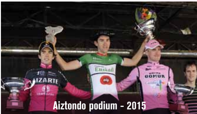
Aiztondo podium - 2015