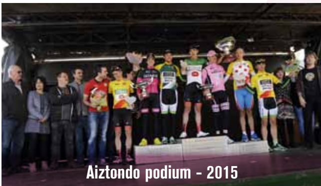
Aiztondo podium - 2015