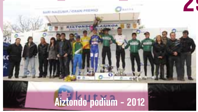
Aiztondo podium - 2012