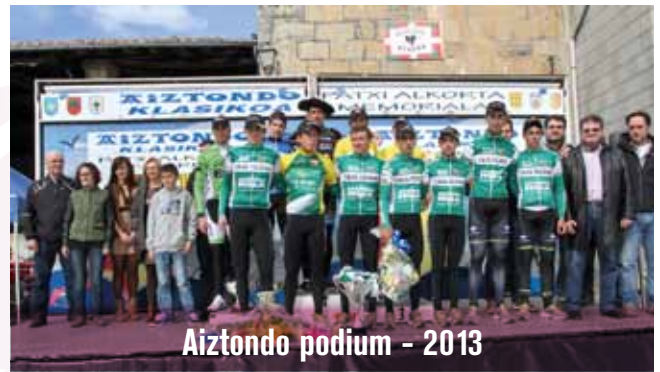
Aiztondo podium - 2013