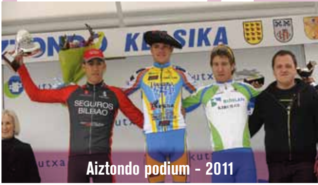
Aiztondo podium - 2011