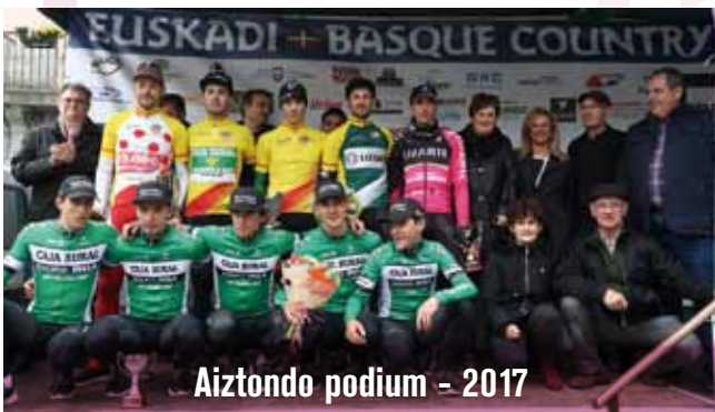
Aiztondo podium - 2017