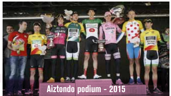
Aiztondo podium - 2015