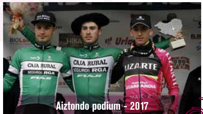
Aiztondo podium - 2017