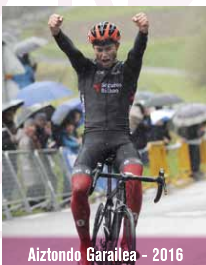
Aiztondo Garailea - 2016