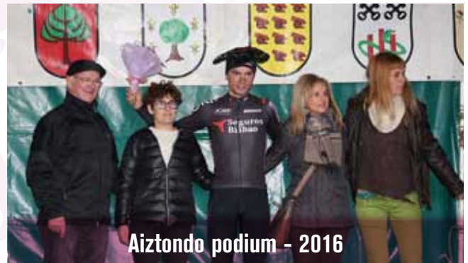
Aiztondo podium - 2016